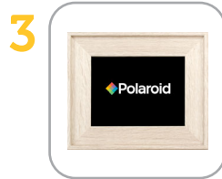
3 Frame powers on automatically when first plugged in