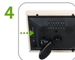
4 Inserte la tarjeta de memoria o una memoria USB (con fotos)