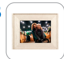
5 Presentación de diapositivas se inicia automáticamente (de la tarjeta de memoria o memoria USB)