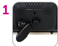
1 Fixer le support