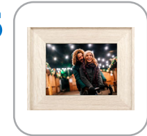
5 Slideshow starts automatically (from memory card or USB Stick)