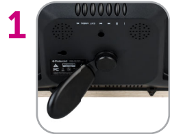
1 Attach stand