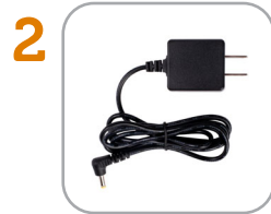
2 Plug in