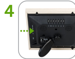
4 Insert memory card or USB stick (containing photos)